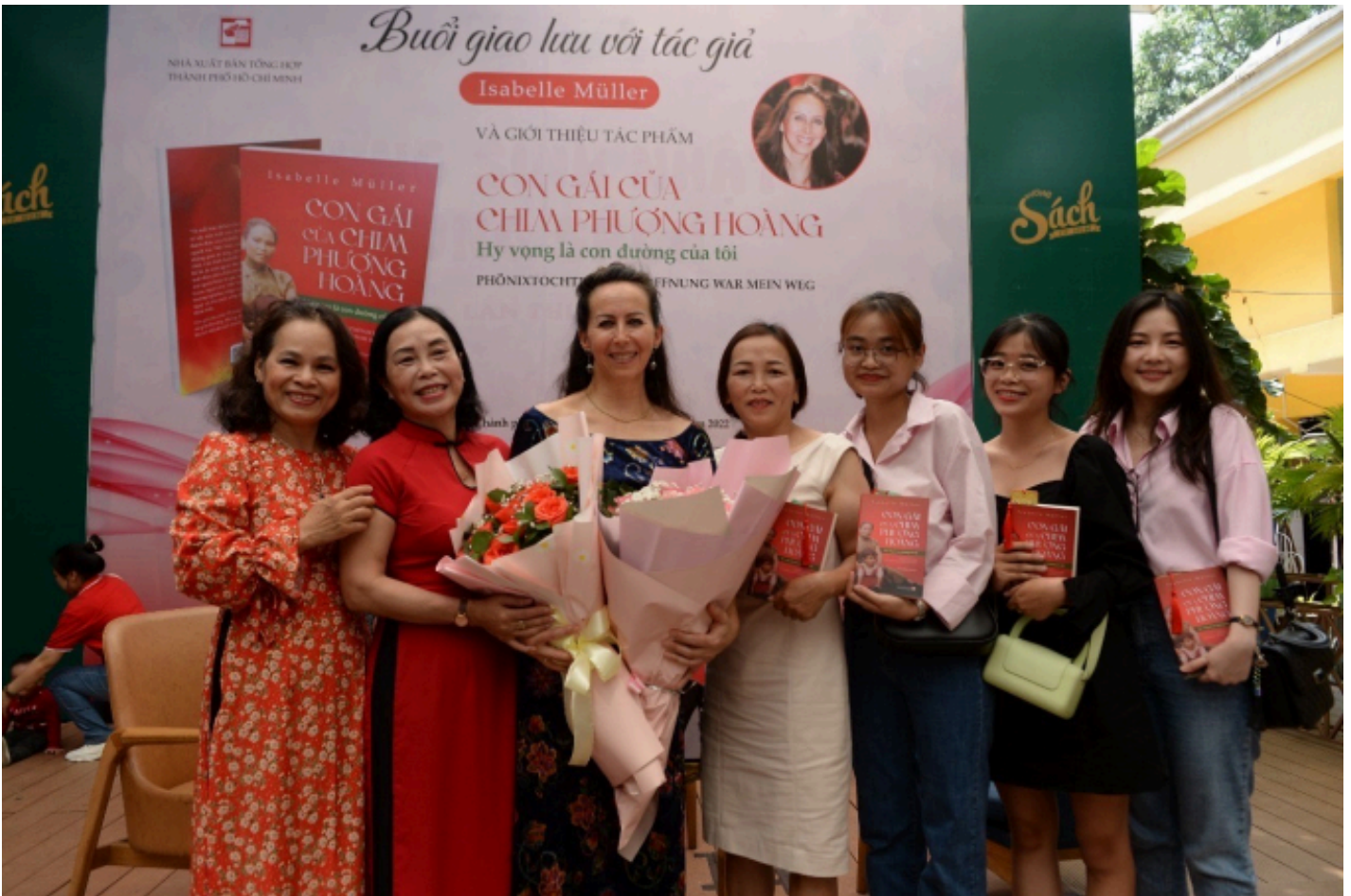
Nữ văn sĩ Isabelle Müller chụp ảnh lưu niệm với độc giả trong buổi lễ ra mắt cuốn tự truyện “Con gái của chim Phượng hoàng - Hy vọng là con đường của tôi”