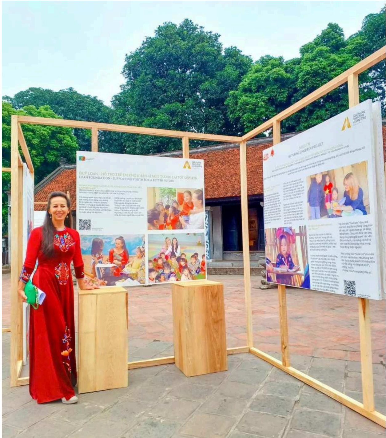
Triển lãm những hình ảnh Quỹ Loan hỗ trợ trẻ em khó khăn vì một tương lai tốt đẹp hơn.

cảm nhận được niềm vui, hạnh phúc của mọi người trên đường phố, trong các cửa hàng, dù thời điểm này vẫn còn những khó khăn. Tôi biết thu nhập bình quân của người Việt Nam chưa cao như nhiều nơi khác trên thế giới, nhưng sự phát triển là rất đáng ghi nhận và tôi nhận thấy mọi người đón nhận những thay đổi này với niềm vui và hy vọng lớn vào những bước chuyển mới của đất nước.