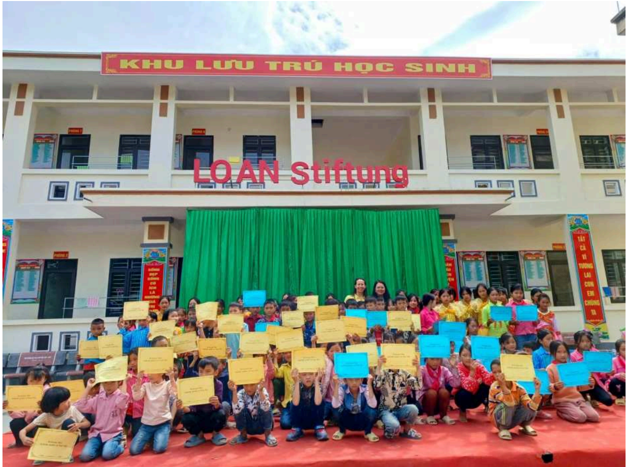
Một khu lưu trú học sinh ở tỉnh Lào Cai được Quỹ Loan tài trợ.