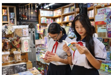
Thiếu nhi TP.HCM vui hè cùng sách hay