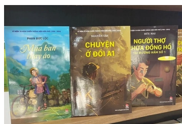
Những cuốn sách về Điện Biên Phủ đã được thay áo mới như nào