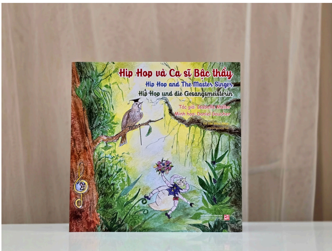
Sách Hip Hop và ca sĩ Bạc thầy .

Sau mùa đông lạnh giá, bọ chét Hip Hop cùng bạn bè ở Vườn thú Thung lũng Xanh thức giấc đón nắng sớm, vui đùa chơi banh tuyết thì bắt gặp én Moa vượt bão tuyết đến cầu cứu. Ở thành phố Falbalo, tiếng ồn đã át hết âm thanh vốn có của thiên nhiên, khiến các loài chim biết hót đã trở nên im lặng, có nguy cơ biến mất vĩnh viễn vì quên mất kỹ năng hót, khả năng tự vệ khi cần. Con người ngày càng ít giao tiếp, trẻ nhỏ vui mắt vào thiết bị điện tử, gia đình ít chuyện trò với nhau. Thiên nhiên nhường chỗ cho nhịp sống ngọt ngào, con người quên dần thú vui và sự thư giãn khi hoà mình vào thiên nhiên.