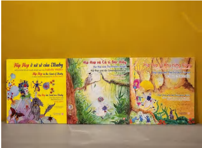
Kindergeschichtensammlung „Hip Hop und der Meistersänger – Hip Hop und der Meistersänger“

anderen Lebensraum zu finden. Sie hoffen, dass die Menschen das Lebensumfeld in Tram Chim wiederherstellen, damit sie nach Hause zurückkehren können. Gutmütiger Sonnenbär – Sonnenbär erhält Futter vom Gartenbesitzer und seiner Mutter, und Sun weiß, wie er es mit Menschen teilen kann, die wie er Hilfe brauchen. Sun bewunderte die menschlichen Gefühle und wollte ihnen ein schönes Überraschungsgeschenk machen. Civet wurde geheilt – Civet, eine verletzte Zibetkatze, die regungslos auf der Straße lag, wurde von zwei Freunden, Minh und Tuan, schnell zur Krankenstation gebracht, um einen Arzt um Hilfe zu bitten.