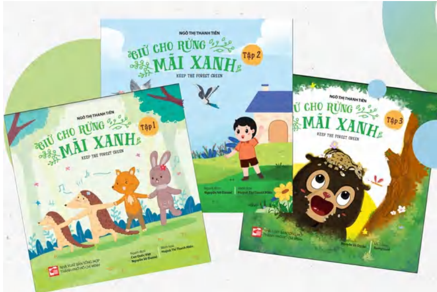
Kinderbuchreihe „Keep the Forest green“

(Vaterland) – Anlässlich des Internationalen Kindertags am 1. Juni und des Beginns der Sommeraktivitäten im Jahr 2024 stellt der Ho-Chi-Minh-Stadt-Generalverlag jungen Lesern die drei Buchreihen „Keeping the Forest Forever“ Green – Keep the Forest Green“ vor. „Hip Hop and The Master Singer“ und „Mother’s Childhood“.