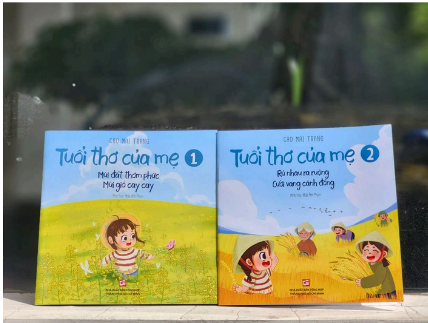
Zweibändige Gedichtsammlung „Mother's Childhood“

Die Arbeit bezieht sich auf den Schutz der Tierwelt vor dem Aussterben und den Schutz unschätzbaren Ressourcen aus dem grünen Wald.