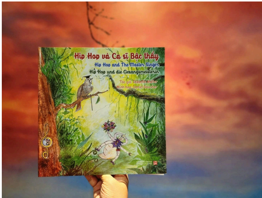
Buch Hip Hop und der Meistersänger – Foto: Ho Chi Minh City General Publishing House

Der Sommer 2024 hat begonnen, auch die Verlage bereiten sich darauf vor, passende Bücher für junge Leser vorzustellen.