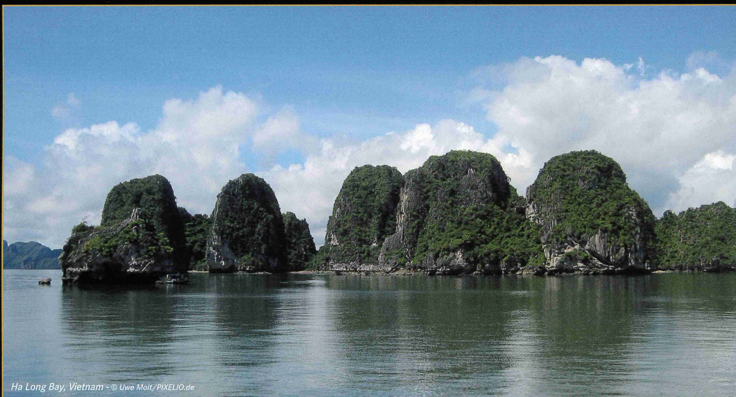
Ha Long Bay, Vietnam