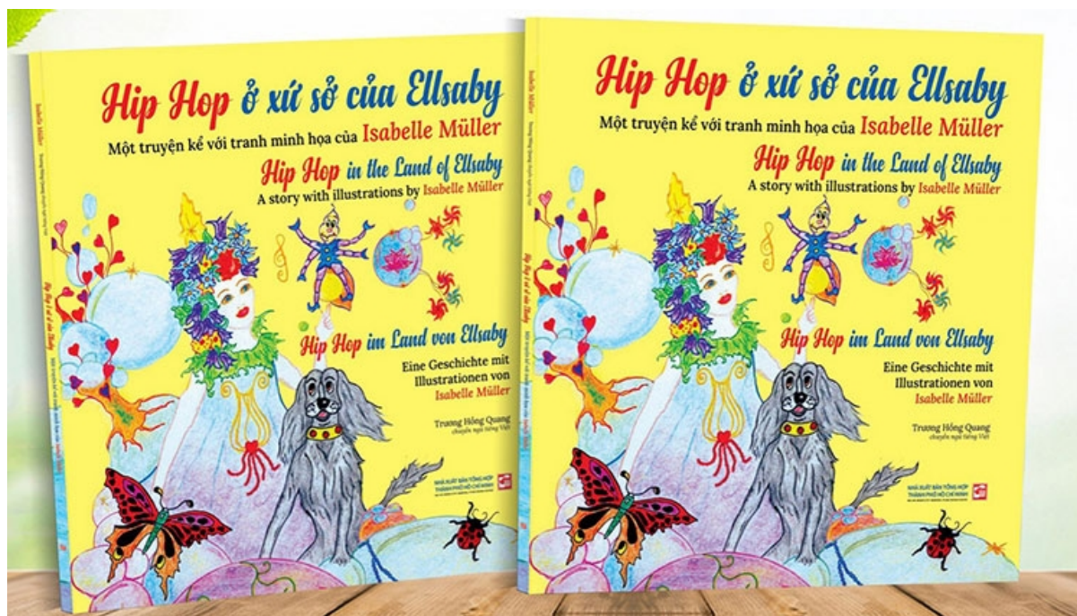
Cuốn sách thiếu nhi của Isabelle Müller

một con chim phượng hoàng” (xuất bản năm 2018) và “Con gái của chim phượng hoàng - Hy vọng là con đường của tôi” (xuất bản năm 2022) của Isabelle Müller chính là những câu chuyện đầy nước mắt, đầy nghị lực sống và dũng khí hướng về tương lai của hai mẹ con cô. Độc giả sẽ được thấy một người phụ nữ can trường, không cam chịu số phận, vươn lên làm chủ cuộc đời mình và cuối cùng trở thành một doanh nhân thành đạt ở Đức.