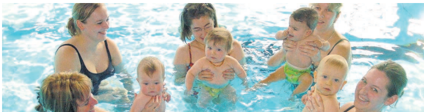
Im Oberwaldbad haben seit 30 Jahren unter der Regie des PSK unter anderem Kinder mit ihren Eltern Schwimmspaß unter fachlicher Anleitung.

Karlsruhe (bla). Der Post Südstadt Karlsruhe (PSK) unterstützt mit seinen sportlichen Aktionen in diesem Jahr Karlsruhe als Unicef Kinderstadt 2010. Start war gestern mit dem Gesundheitstag auf dem Gelände des PSK an der Ettlinger Allee. Weiter geht's mit der Feier „30 Jahre Oberwaldbad“ am nächsten Samstag und dann im Juni mit dem Fidelitas Nachtlauf.